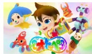
■オトツペ (株)博報堂