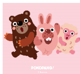
■ポコパン (株)ツリーノッド