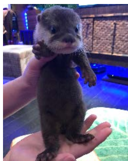
■ちいたん ちいたん