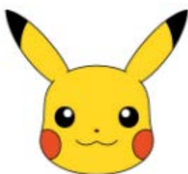
■ポケモン (株)小学館集英社プロダクション