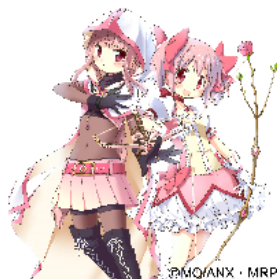
■マジアレコード 魔法少女まどか☆マギカ外伝 (株)アニプレックス