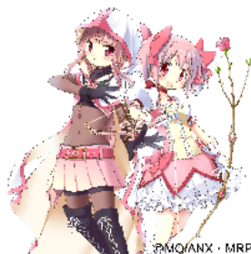
■マジアレコード 魔法少女まどか☆マギカ外伝 (株)アニプレックス