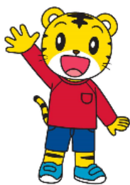
■こどもちゃれんじ (株)ベネッセコーポレーション